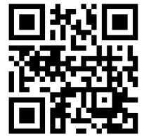
臺北市中山國小 QR Code